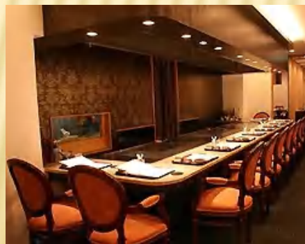
和歌山市 ステーキハウス (落ち着いた店舗)