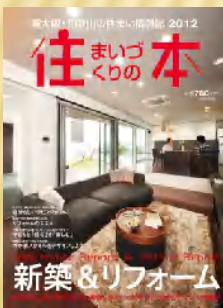
住まいづくりの本 2012 へ掲載しています。