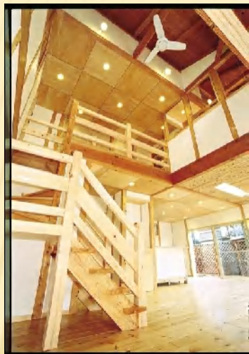
粉河町・K邸 住宅 (無垢材をふんだんに使用)