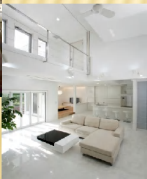
有田川町・N邸 住宅 (大空間リビング)