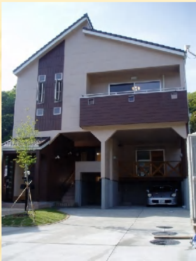
由良町・H邸「高床住宅」 (建物基礎部分が収納庫、浸水にも安心)